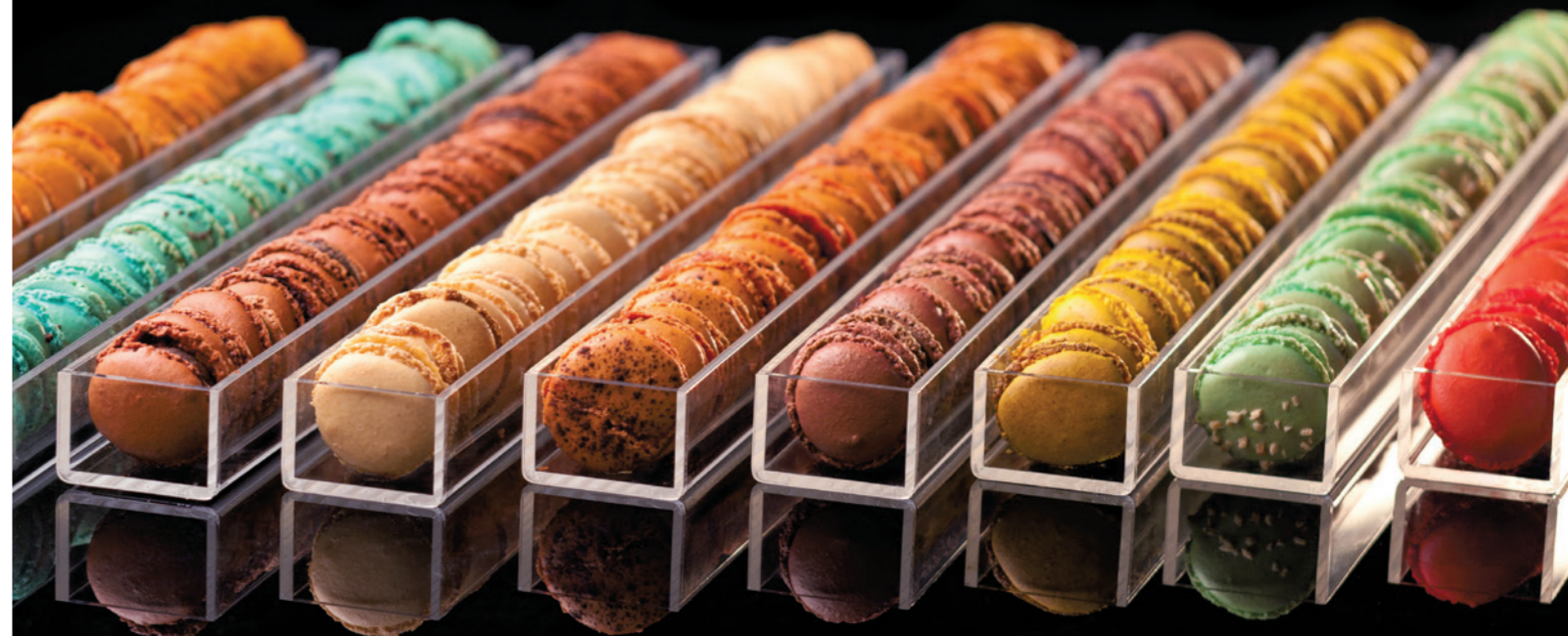
Doigts de fée