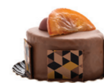
Succulent à l'orange