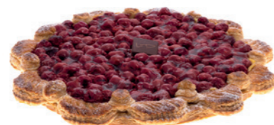
Tarte aux griottes