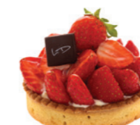
Tartelette aux fraises