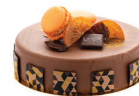
Succulent à l'orange