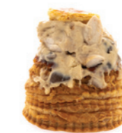
Bouchée aux ris de veau