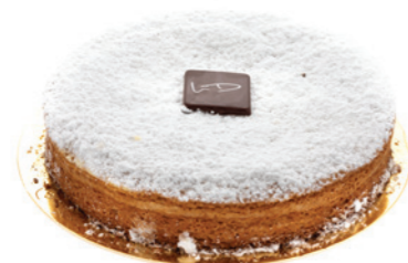
CHAMPENOIS - 5 PARTS 20.00€ Pâte macaron poudre d'amandes.