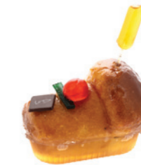
Baba au rhum