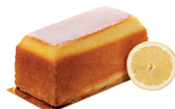
CAKE AU CITRON - 10 PARTS 23.00€ Quatre quart et zeste de citron

*À PARTIR DE 20 PERS UNE PLANCHE VOUS SERA CONSIGNÉE 5.00€.