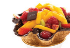
Coupelle de fruits