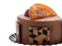
Succulent à l'orange