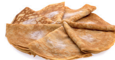
Crêpes au sucre