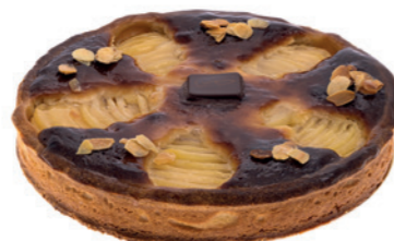
Tarte poires amandes