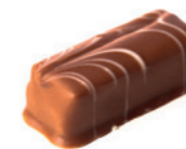
FEUILLES Chocolat Jivara - 40% Croustillante, ganache ivoire vanille