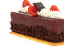
Inspiration Forêt Noire