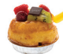
Baba aux fruits

POUR FÊTER VOTRE ANNIVERSAIRE, NOUS RÉALISONS VOTRE GÂTEAU PERSONNALISÉ SUR DEMANDE ET PHOTO NOS SUGGESTIONS SUR COMMANDE : Pièces montées - Wedding cake - Château de princesse - Tête de Mickey.