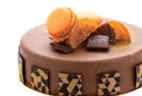
Succulent à l'orange