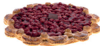
Tarte aux griottes