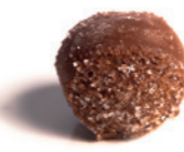
PRUNELLE DE TROYES Ganache lait à la Prunelle de Troyes