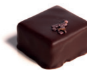
CAPPUCCINO Chocolat Tanariva 33% - Lait café