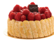
Charlotte aux framboises