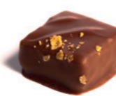
FEILLANTINE Praliné noisettes 60%