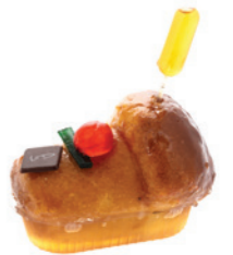
Baba au rhum