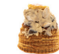
Bouchée aux ris de veau