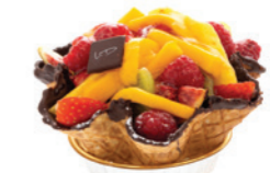
Coupelle de fruits