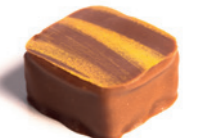
AKIMI Croustillant praliné, noisettes torréfiées, ganache, praliné, Jivara lactée - 40%