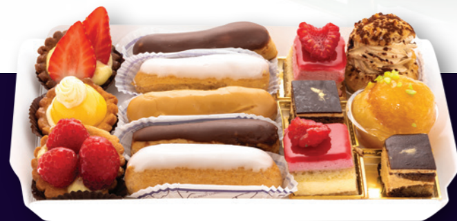
Assortiment de 14 mignardises 15.40€