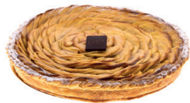
Tarte aux pommes lamelles