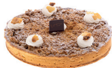
Tarte aux pommes et crumble