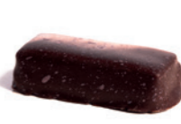
ALVARO Chocolat Illanka Pâte de fruits : Mûres, cassis, myrtilles - 40%