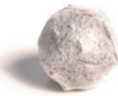
JIVARA PASSION Ganache coulante Jivara passion - 40%