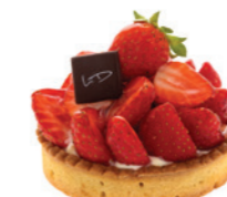
Tartelette aux fraises