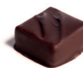
GUANAJA Fève de tonka 70% - Chocolat Guanaja