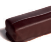
BRASILIA Chocolat Macaé pur Brésil noir 62% - Thé noir - Darjeeling