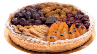
Tarte panachée aux fruits