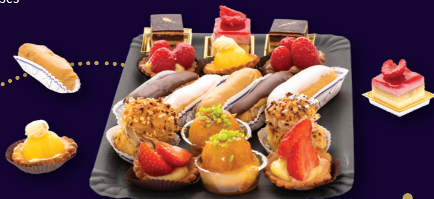
Assortiment de 20 mignardises 22.00€